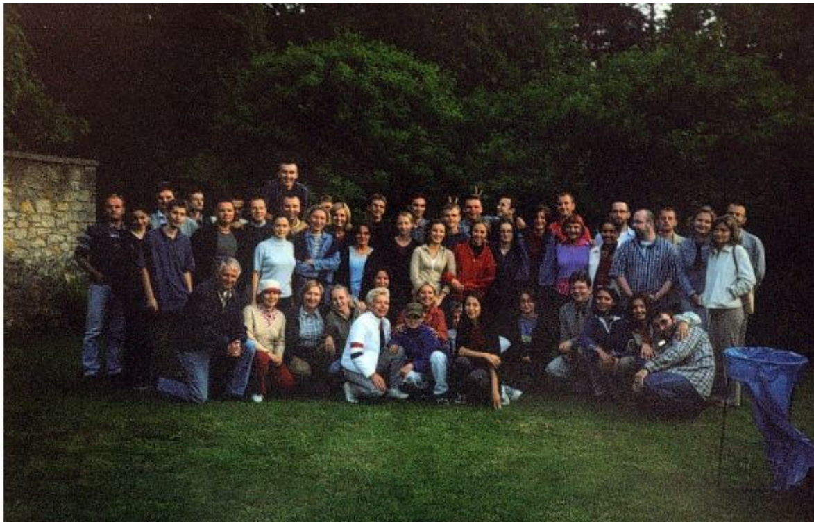
Studenci specjalności PiI wraz z pracownikami Katedry PiI (zdjęcie pochodzi z Majówki Specjalności , maj 2002 r.)