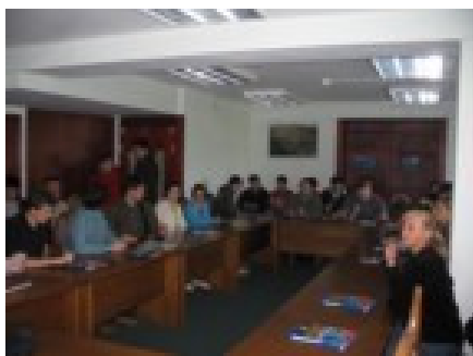
Nasi studenci podczas zajęć terenowych w Małopolskiej Agencji Rozwoju Regionalnego